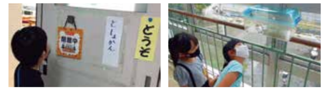
As escolas têm muitas salas de aula e professores diferentes! Conseguimos encontrar vários seres vivos! Explorar a escola é muito emocionante!

Aprendizagem integral centrada em estudos da vida (Hora da Empolgação)