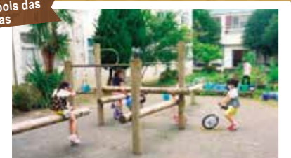
Permite que crianças de diferentes séries escolares se misturem. (Clube Kids durante pós-aula)

Atividades Pós-Aula (Programas Infantis Pós-Aula da Cidade de Yokoyama)