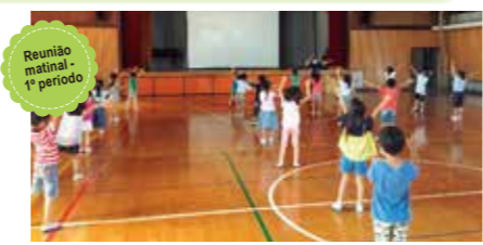
Reunião matinal - 1º período No ginásio, nos movimentamos bastante brincando de mímica e jogo de palavras!