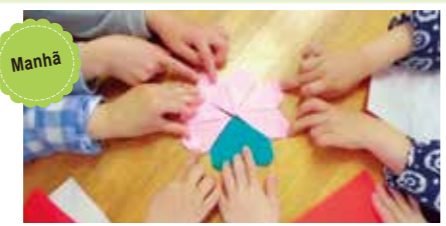
Manhã Dobrando e enfileirando os origamis, fizemos amizade!