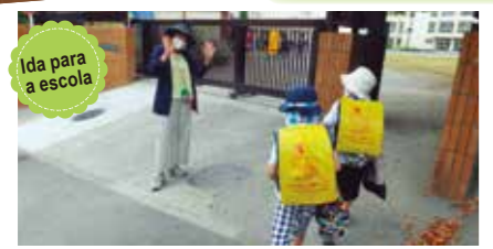
Ida para a escola Todos vão à escola em segurança! A diretora também observa a nossa chegada!

Atividades modificadas para garantir que a vida escolar comece com sem preocupações (Hora da Amizade)