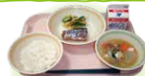
(Exemplo de menu) Arroz, sopa com carne porco e legumes, peixe cozido, pickles instantâneos, leite

Várias medidas são tomadas na escola para permitir que as crianças comam e apreciem a merenda escolar. As diferenças entre o tempo necessário e a quantidade de comida que conseguem comer são comuns no início da primeira série, portanto é preciso considerar o volume da refeição. Ainda, o tempo de distribuição, refeição e limpeza após a refeição é estendido em comparação com as outras séries, até se acostumarem. Comunique suas preocupações com relação a alergias alimentares (alimentos a serem excluídos, etc.) durante exames de saúde ou orientações, etc., antes que a criança ingresse na escola. Além disso, é ideal que você interaja com seus filhos durante as refeições em casa para que eles se acostumem a todos os tipos de alimentos, e aprenda a desfrutar das refeições.