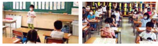
Lemos, escrevemos e fazemos contos! Os professores nos ensinam pacientemente!

Aprendizagem centrada no currículo, etc. (Hora do Progresso Constante)