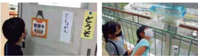
Maraming classroom at teacher sa paaralan! Marami akong nakitang mga insekto o hayop. Ang sayang lumibot sa paaralan!

Kabuuang pag-aaral na nakatutok sa Life Environment Studies (Wakuwaku Time)