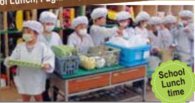
Ipinapaubaya sa aking ang pag-serve ng pagkain at side dish dahil ginagawa ko rin ito sa bahay at kindergarten.

May mga paaralang sabay-sabay kung papasok at pauwi sa simula ng pasukan. Hindi lamang ang mga guro, pati na rin ang mga PTA at mga boluntaryo na naninirahan sa lugar ay nagbabantay upang makauwi nang ligtas ang mga bata hanggang sa sila ay masanay sa elementary school.