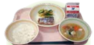
<<Lunch Menu ng isang araw>> Kanin • Pork soup • Pinakuluang isda • Instant pickles • Gatas

Kung may problema sa allergy o bagay na hindi makakain, bago pumasok, sumangguni sa paaralang papasukan at komunsulta rin sa doktor sa school check-up na gagawin sa paaralan bago magsimula ang pasukan. Magluto rin ng iba't-ibang uri ng pagkain para masanay ang bata at kumain ng sabaysabay para isipin ng bata na masaya ang gawaing ito.