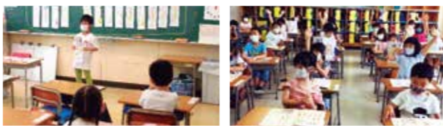
Tinuturuan kami ng guro magbasa, magsulat at magkalkula.

Pag-aaral na nakatutok sa curriculum (Gungun Time)