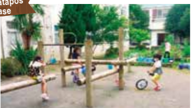
Makakapag-enjoy sila ng pagsasamahan ng mga bata mula sa ibang grado. (Afterschool Kids Club)

Pasilidad para sa mga bata pagkatapos ng eskuwela (Afterschool Kids Club)