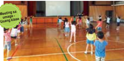
Pinakilos ko nang maigi ang aking katawan sa gym nang naglaro ng charades at ng rhythm shiritori.