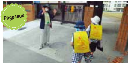
Ligtas kaming papasok sa paaralan. Protektado kami ng nagbabantay na prinsipal.

Mga binagong gawain sa paaralan para manatiling ligtas sa simula ng pasukan (Nakayoshi Time)