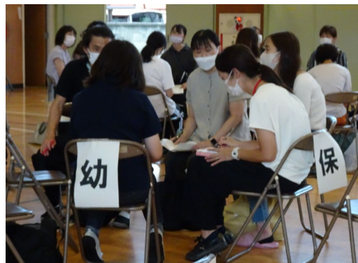
子どもの姿を通した幼保小職員の対話