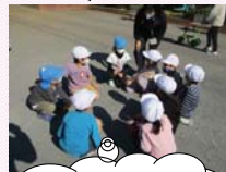
1年生がリード している姿があ りました