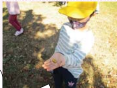
黄色どんぐりみつけたよ