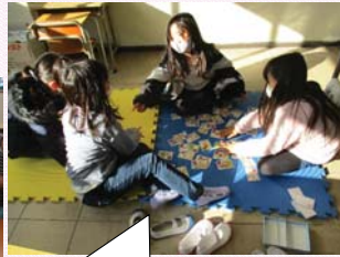
大きいマットの上で カルタをしよう。