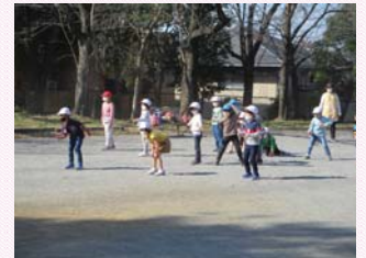
「だるまさんがころんだ」にも いろいろなルールがあることを知 りました!!