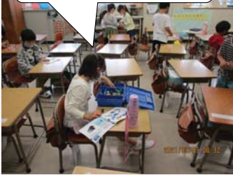
ラキュー、保育園でも やったことがあるよ。