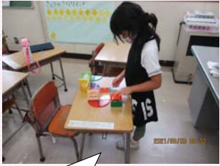
ビタゴラスでお城を作ろう

保育園の先生にどんなおもちゃで遊んでいるのか聞いて、ビタゴラス、ラキューを購入しました。 大きなジョイントマットを購入して、マットの上で本を読んだり、カルタをしたりできるようにしました。