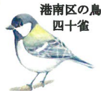
港南区の鳥 四十雀