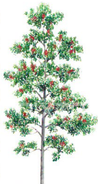
港南区の木 クオカネチ