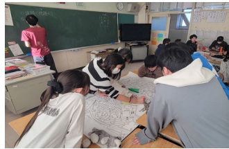
《みんなの83交通安全ラボ》