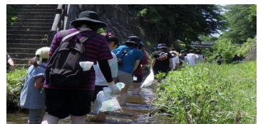
《川のクリーンアップ》