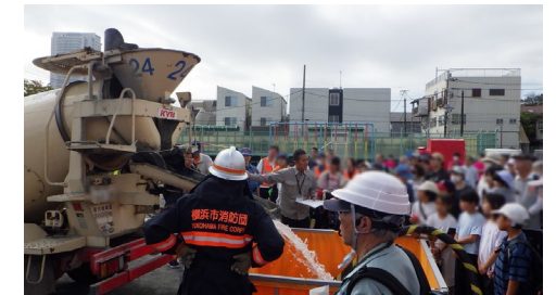
地域防災拠点運営訓練の様子 コンクリートミキサー車による補水訓練