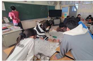
《みんなの83交通安全ラボ》