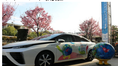
庁用車のラッピング