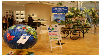
商業施設でのイベント開催

また、グリーン社会の実現に向け、地域・企業の皆さまと連携しながら、環境にやさしい暮らしを広げる取組を続けていきます。