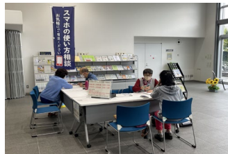
《街のアドバイザーによるスマホ相談会》