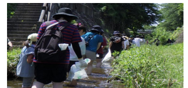
《川のクリーンアップ》