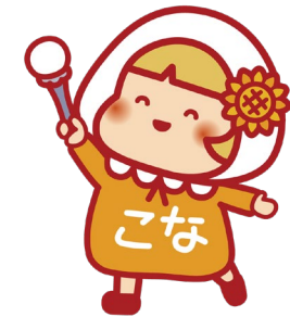
港南ひまわりプラン 推進キャラクター「こなちゃん」

第5期プランの目標である「笑顔でくらせるまち」に向け、皆さまと一緒に4つのアクション「知る」「つながる」「できることをやる」「支えあう」に取り組んでいきます。