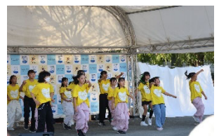
《ゆめワールドで躍動する子どもたちの様子》