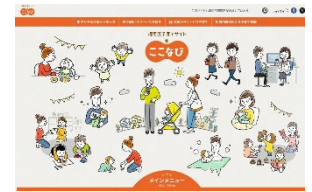
《港南区子育てサイト「ここなび」》