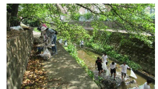
《川のクリーンアップの様子》