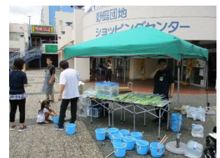
《野庭団地ショッピングセンターでの打ち水の様子》