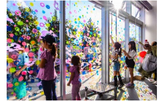
《令和5年度公開参加型文化イベントの様子》