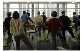
《生活習慣改善プログラムの様子》