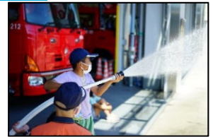
《ひまわり防災イベントの様子》