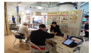
《食中毒予防啓発展示会の様子》