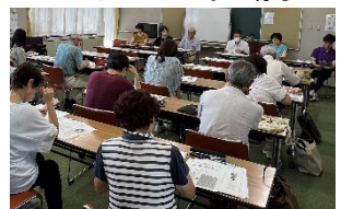
《アドバイザー派遣の様子》