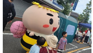
《地域イベントに83運動啓発を行う様子》