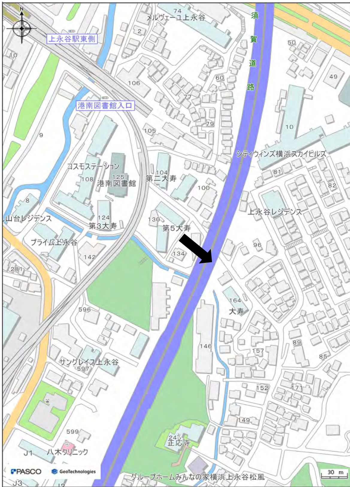
港南区区民生活マップより