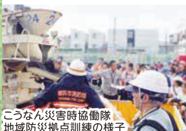
こうなん災害時協働隊 地域防災拠点訓練の様子

昨年、港南区が選んだ漢字は「備える」で、この言葉が示すように、 防災・防犯への意識が高まった1年となりました。一昨年発足した、 企業の保有する組織力や専門的な技術・資機材を生かし、災害時に 地域を支援する「こうなん災害時協働隊」は、現在約170の事業所に