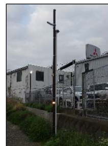
本設防犯灯(イメージ)