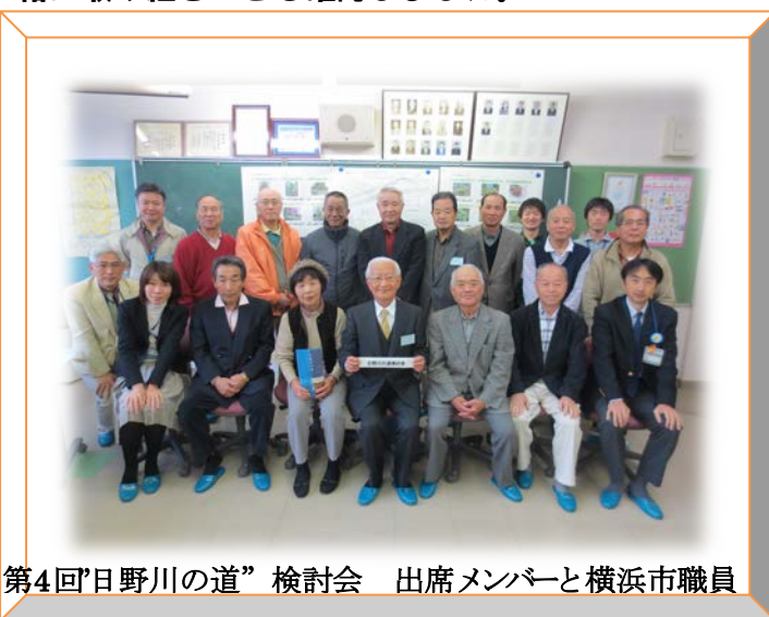
第4回“日野川の道” 検討会 出席メンバーと横浜市職員