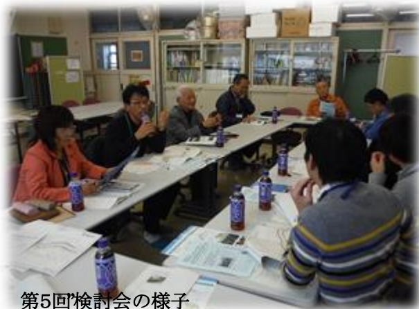
第5回検討会の様子