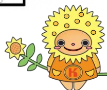
こうなんタネットちゃん