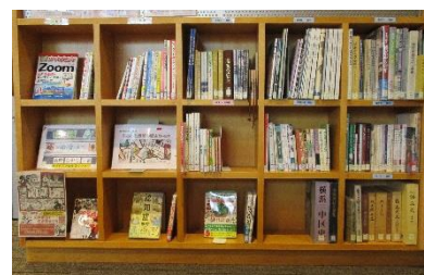
閲覧図書コーナー