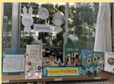
「課題図書コーナー」