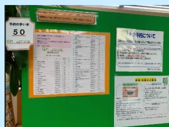
横浜市立図書館予約の多い50の紹介