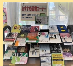
「おすすめ図書コーナー」