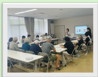
～スマホの使い方講座の様子～

③日程確定後、申込者と街のアドバイザーで当日に向けた調整（事務局より、双方の連絡先を共有いたします）