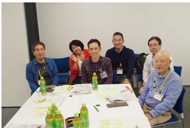
5グループ (健康づくり など)