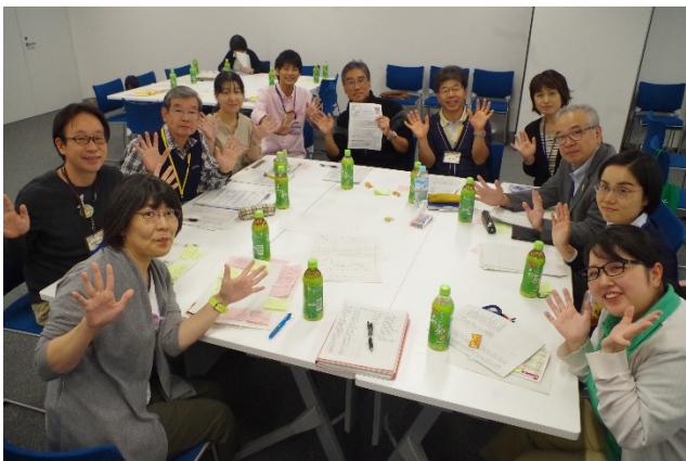
3グループ (地域の魅力づくり)