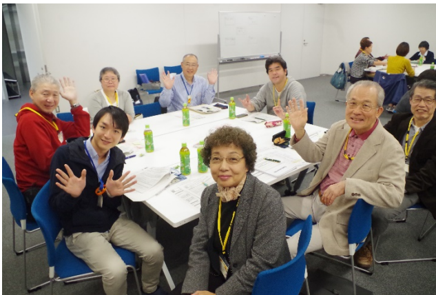
1 グループ (防災・減災)