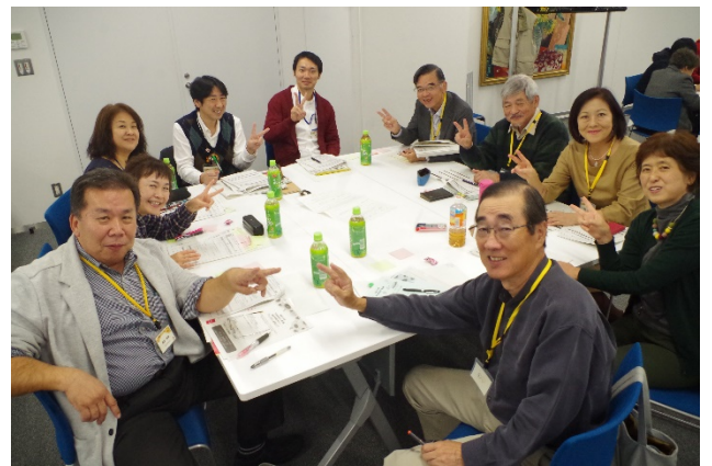
4グループ (担い手の確保)