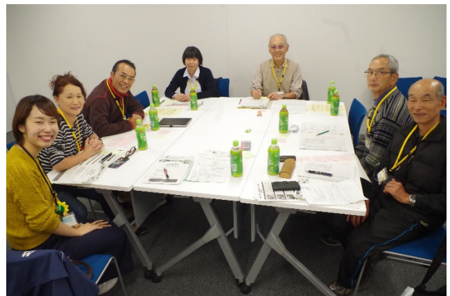
2グループ (見守り・支えあい)