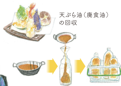
天ぷら油(廃食油)の回収