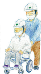
災害時要援護者支援