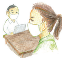
人との距離の確保