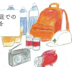
家庭での災害への備え