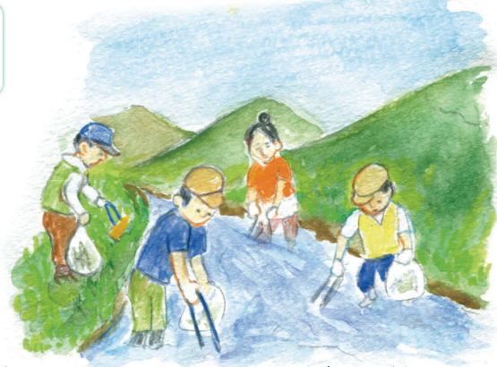
河川クリーンアップなどの清掃活動