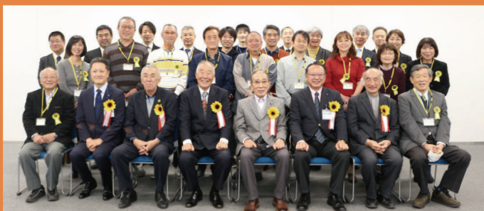
学び舎ひまわり(地域づくり大学校)