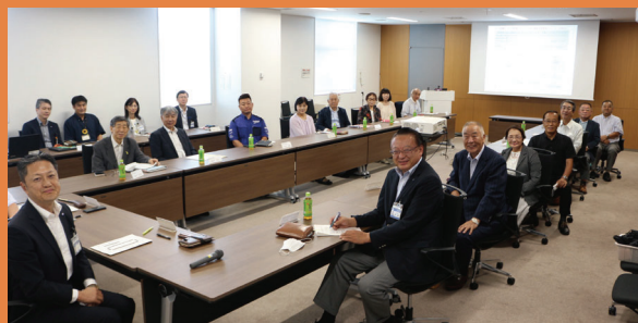
協働による地域づくり推進協議会