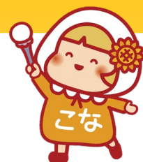
港南ひまわりプラン 推進キャラクター こなちゃん

各地区の個性あふれる計画を皆さまと共有し、誰もが笑顔でくらせるよう、一緒に考えてみませんか？