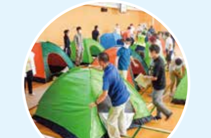
地域防災拠点訓練