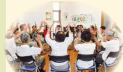
五楽会(高齢者サロン)