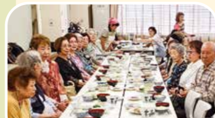
麻の会(一人暮らし高齢者食事会)