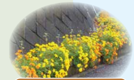
ふれあい花壇(吉原小学校)