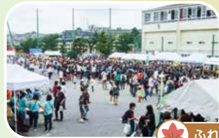
ふれあいフェスタ