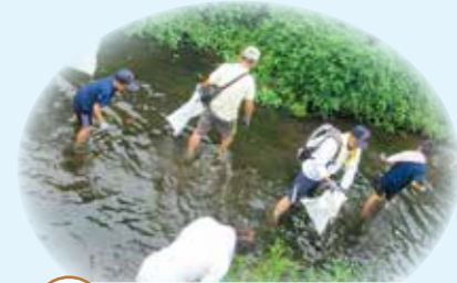
日野川クリーンアップ