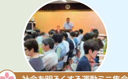
社会を明るくする運動ミニ集会