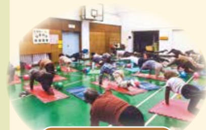
ひまわり体操教室