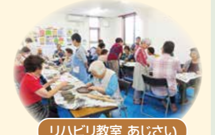
リハビリ教室 あじさい