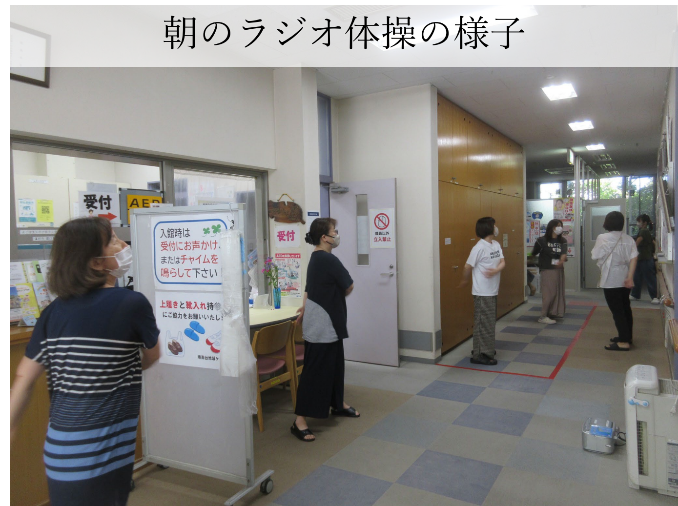
朝のラジオ体操の様子

玄関に看板を出し、 地域の方も職員と一緒に 参加していただいております。 通年実施しており、短い時間ですが、 運動習慣が身に付きました。