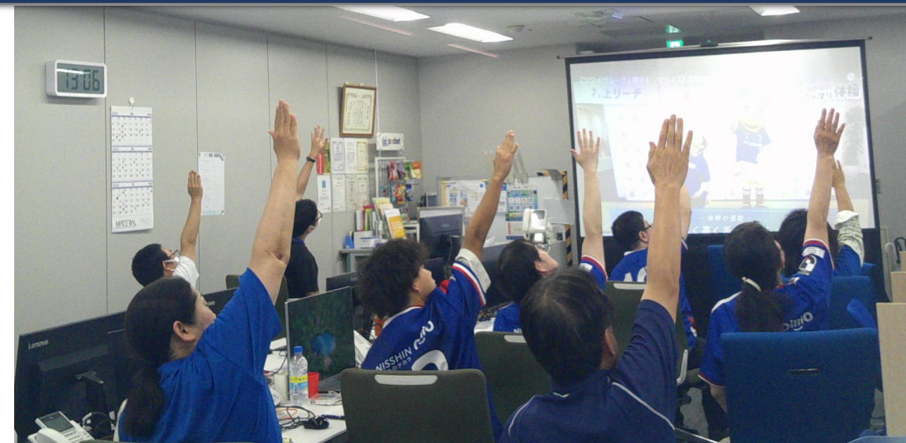
オリジナル体操の様子