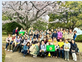
R8.4.1 桜ウォーク (久良岐公園周辺)