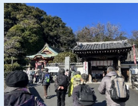
R6.1.9 七福神巡り (磯子区周辺)