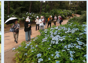
R7.6.24 新緑ウォーク (金沢八景~八景島)