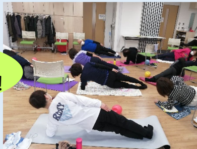
②上永谷駅前地域ケアプラザでの様子