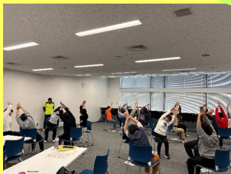
運動講師による講義の様子