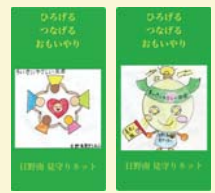
日野南見守りネットステッカー

「ひのみな見守りネット」は、“ひろげる・つなげる・思いやり”の趣旨に賛同いただいた地域の協力店にステッカーをお配りし、来店者や訪問先での“ちょっとした気づき”による「見守り・相談のつなぎ役」に協力していただいています。店頭には、「地域のやさしいお店」のしるしとして、日野南小学校の生徒さんがデザインした「日野南見守りネットステッカー」を貼っていただいています。区役所の取組にもご協力いただき「見守り協力事業者」の印としてステッカーを貼っていただきました。