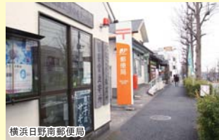
横浜日野南郵便局