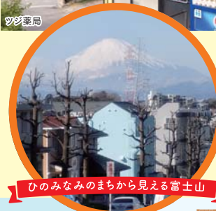
ひのみなみのまちから見える富士山