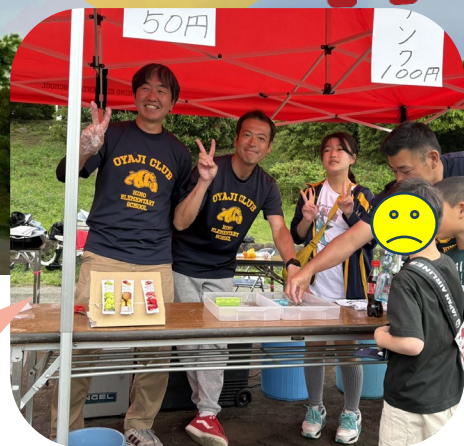
おやじの会の皆さんが笑顔でお出迎えしてくれました