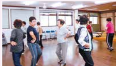
雑色喜楽会健康体操