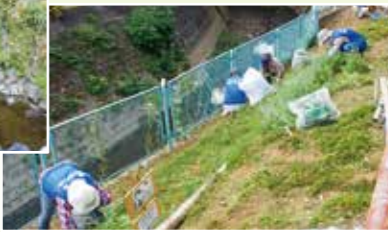
取水庭公園整備・清掃