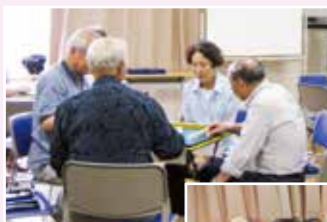
関ふれあい サロン