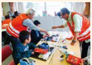
子どもモノづくり