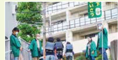
あいさつ運動推進チーム