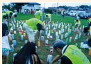
雑色キャンドルナイト