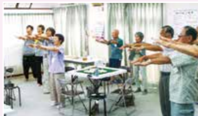
雀友会(グリーンタウン)