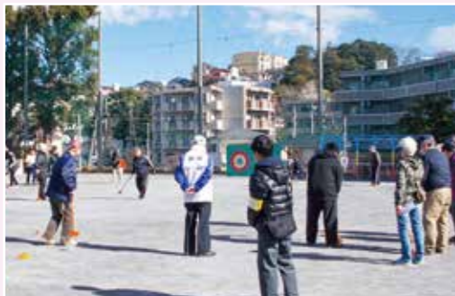
日下グラウンドゴルフ