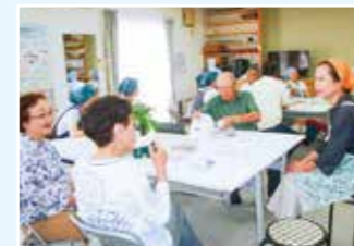
グリーンタウンカフェ