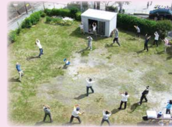
元気はつらつラジオ体操(笹下ハイツ)