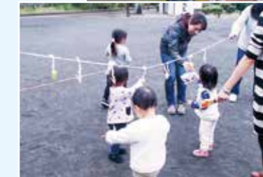
公園であそびましょう