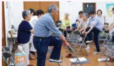
雑色南地域高齢者サロン