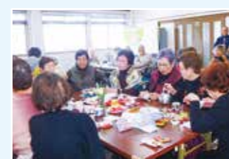
雑色あつまろカフェ