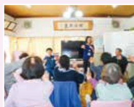
南平台シルバー交友会