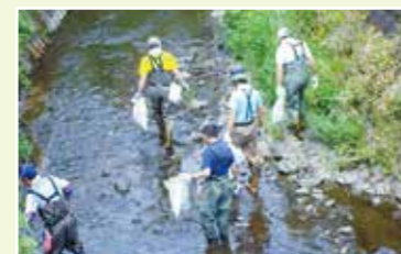
笹下川クリーンアップ