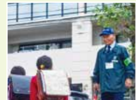
地域の見守り活動