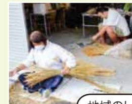
地域のしめ縄づくり