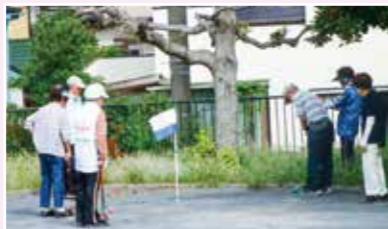
グリーンタウングラウンドゴルフ