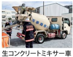
生コンクリートミキサー車

拠点運営委員からは「事業所が参加することで横のつながりが強くなる」との声があった。