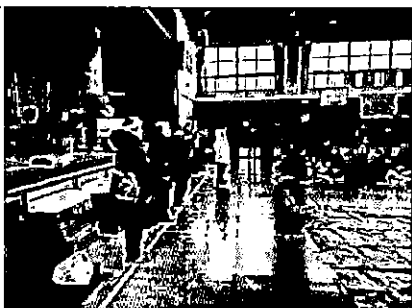
運営委員会による避難者数報告 (情報伝達訓練)