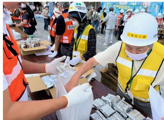
【配給物資引き取り訓練】