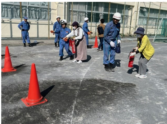
【消火器取扱い訓練】