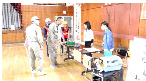
ペット防災啓発状況