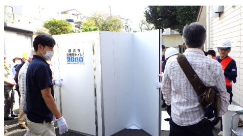
下水直結式仮設トイレ組み立て訓練