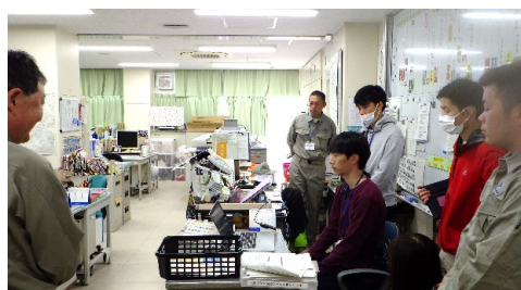
危機管理システム操作訓練