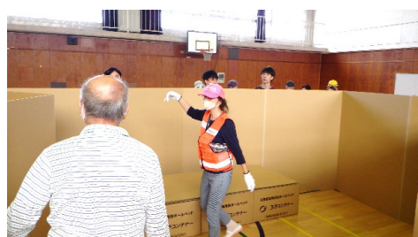
段ボールベッド・間仕切り設定訓練