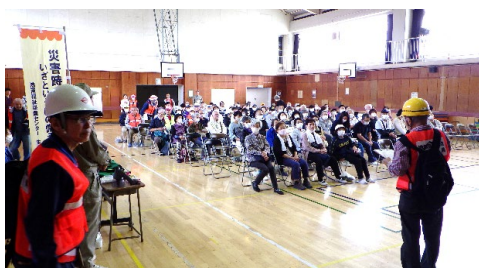
拠点委員長による区割り説明