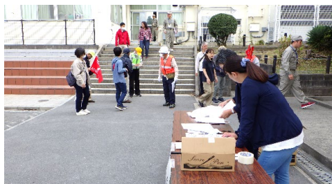
避難者受付の設置状況