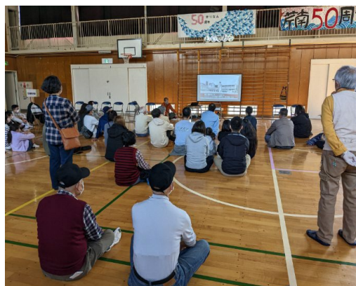
↑ 地域防災拠点開設・運営マニュアルDVD視聴