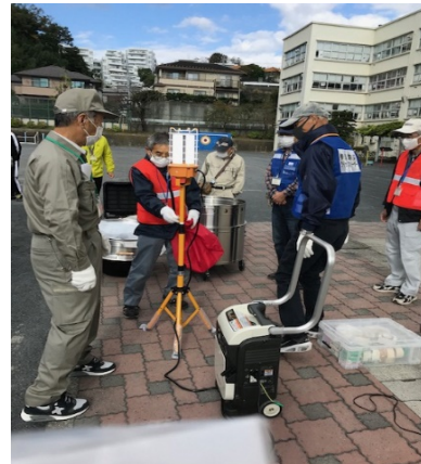
投光器、ガス式発電機取扱訓練