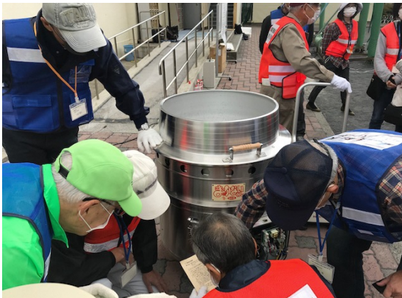
灯油式かまど取扱訓練