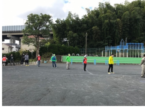
ソーシャルディスタンスを確保しての受付状況