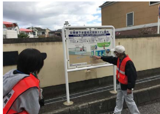
下水道直結式トイレ設置場所説明