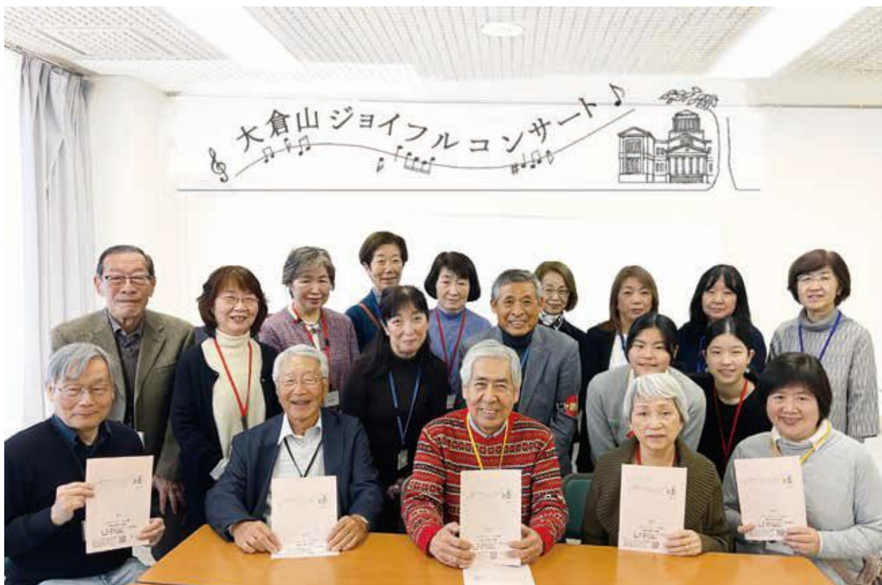
(大倉山ジョイフルコンサートの皆さん)