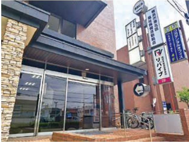
▲ 港北区ボランティアセンター 入口

住所: 横浜市港北区大豆戸町13-1 吉田ビル206 港北区社会福祉協議会内 電話: 045-547-2238 FAX: 045-531-9561 メール: vc@kouhoku-shakyo.jp 交通: 東急東横線「大倉山」駅より徒歩7分 開館時間: 月～土曜日 9時～17時 (祝日、年末年始をのぞく)