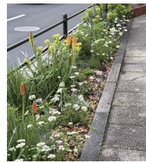
綺麗になった花壇

また、毎回ごみ拾った活動写真をSNSアプリ「ピリカ(Pirika)」に投稿し、世界中のユーザーに共有しています。