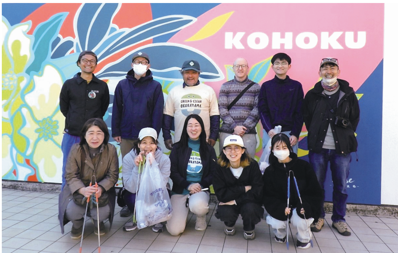
(「GREEN & CLEAN 大倉山」の皆さん)

街の緑化・美化活動を行っているボランティア団体 「GREEN & CLEAN (グリーンアンドクリーン)大倉山」