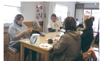
ごみ拾い後にコーヒータイムになるときもあります！