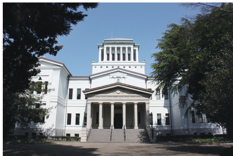
▲ 横浜市大倉山記念館

東急東横線大倉山駅の坂を上った木立の中に「横浜市大倉山記念館」があります。昭和7年(1932)に創建された建物は90年を超える今も当時の趣を残したままです。大勢の入場者を集める春の「観梅会」や秋の「大倉山秋の芸術祭」。また5月には「こどもフェスティバル」、12月は「小さな丘のメリークリスマス」など、地域に密着した催し物が多数行われる文化施設として市民に親しまれている「横浜市大倉山記念館」をご紹介します。