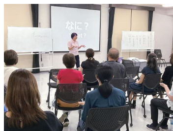
国際手話に触れてみよう

スライドを使ってデフリンピックの歴史や競技種目について学んだ後は、日本手話と国際手話の違いを、実際に手を動かしながら体験することで、理解を深めています。