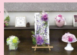
展示してある作品の一部

2か月ごとに季節にあった花材で素敵なアレンジメントを作っています。とても人気で申込み開始からすぐに定員になるそうです。受付はお電話のみ。