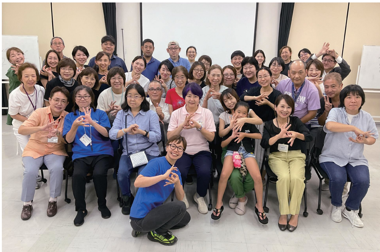
(港北区手話サークルあじさいの会の皆さん)

手話を通じて地域とつながり、仲間と想いを分かち合う 港北区手話サークルあじさいの会