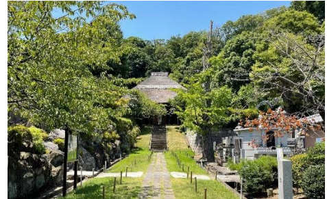
四季の自然豊かな西方寺 (写真は夏の様子)