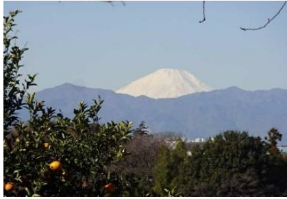
新羽丘陵公園周辺の コース上から見る富士山

新羽の西側にある丘陵地帯には、今も深い緑あふれるエリアが広がっています。裏道を辿りながら、そんな一帯を歩き、かつて「新羽八景」とも呼ばれた風景を眺め、季節の花木を楽しむウォーキングツアーです。ちょっと懐かしさも感じる、奥深い新羽の魅力を満喫しましょう。