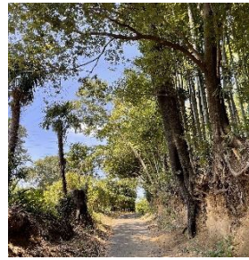
谷戸の奥にひっそり 静寂の真間土坂