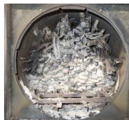
窯出し前（火入れ後）