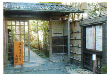
鎌倉市鍋木清方記念美術館