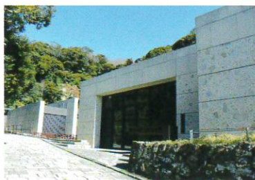
鎌倉歴史文化交流館