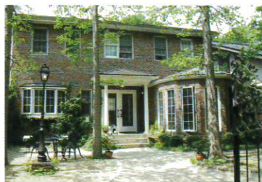
北鎌倉 葉祥明美術館

鎌倉の豊かな歴史風土を満喫しながら、 学芸員と一緒に 時代をこえてアートを体感しましょう。