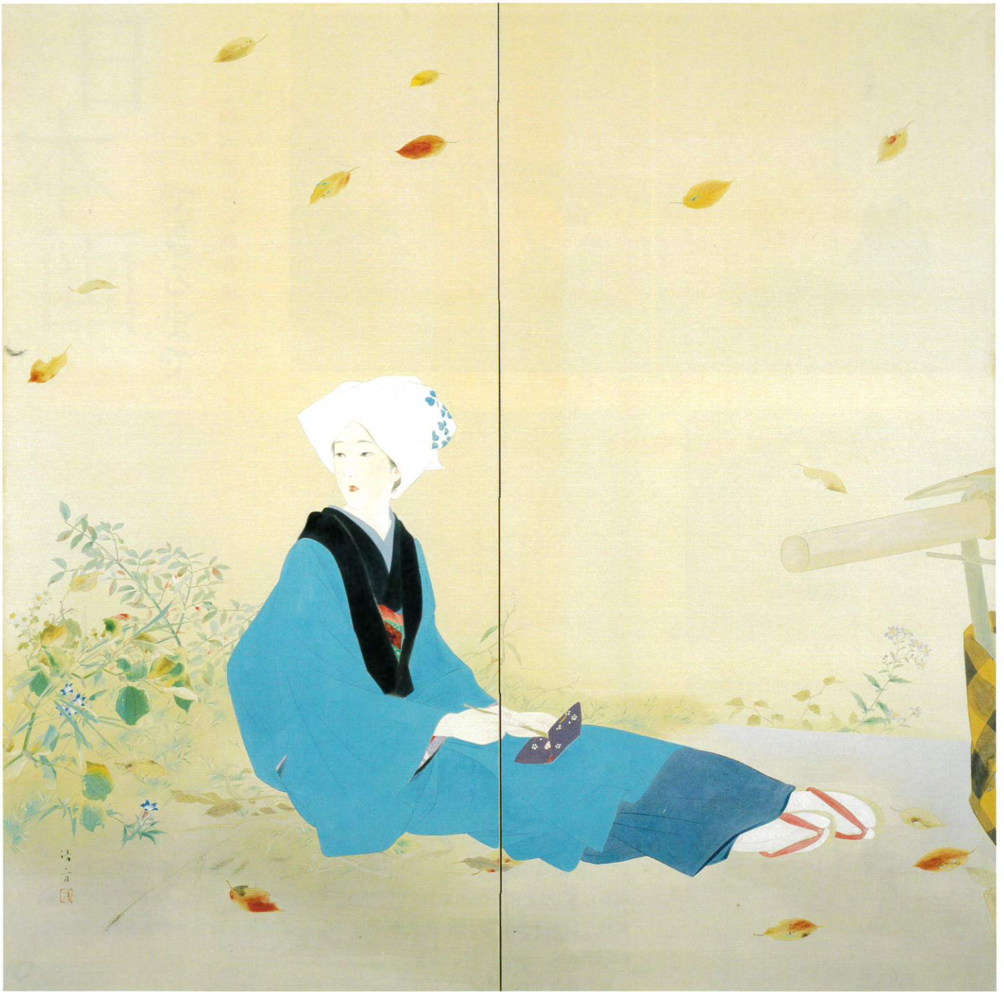
《桜もみぢ》(左隻)昭和7年(1932) 当館蔵 Sakura Momiji (Autumn Color of Cherry Leaves, Left Screen) (1932)