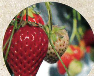
いちごの収穫体験 ペアチケット