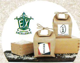
【横浜エクセレンス賞】 横浜武道舞(米) & 試合観戦ペアチケット