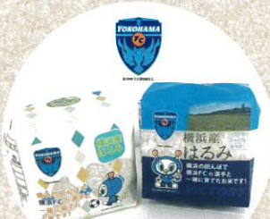
【横浜 FC 賞】 横浜 FC 応援米