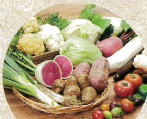
横浜野菜 味わいセット