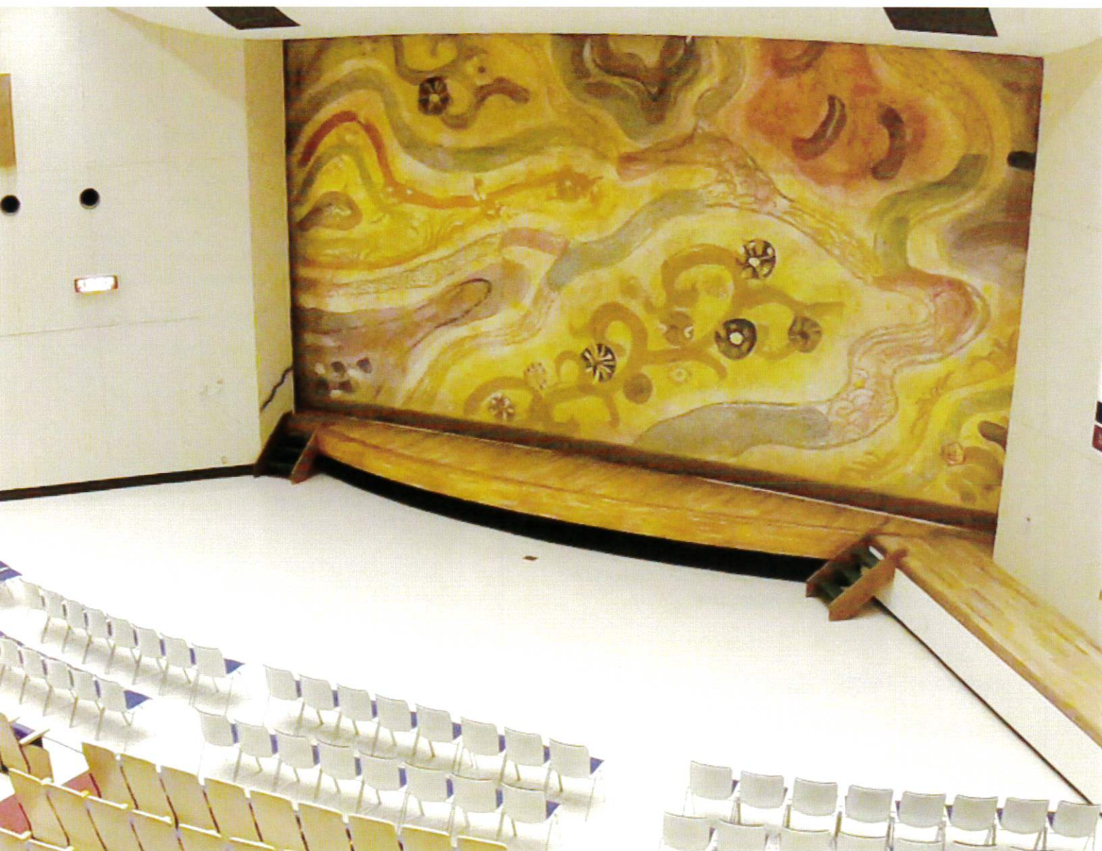
写真：港北公会堂の緞帳「陽に萌える丘」