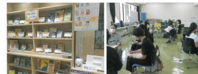
企画展示「港北の小学生がえらぶ本」(日吉の本だな)