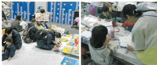
絵本などの展示(横浜アリーナ)