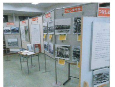
展示「つなしま今昔～網島に温泉があった頃～」(港北図書館)