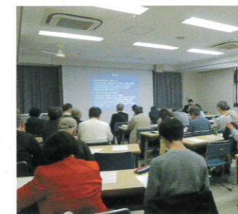
港北区読書講演会(菊名地区センター)