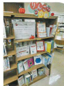
りんごの棚(港北図書館)