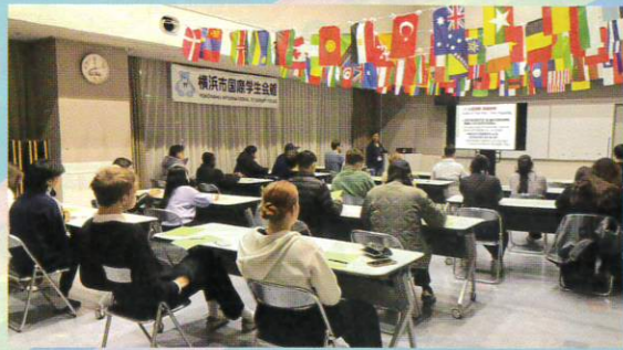
退館者説明会 注意事項が多いなあ