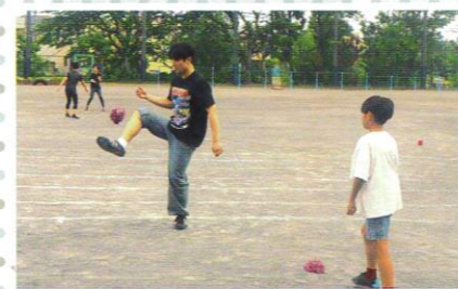
校庭で韓国の"チェギチャギ"を披露