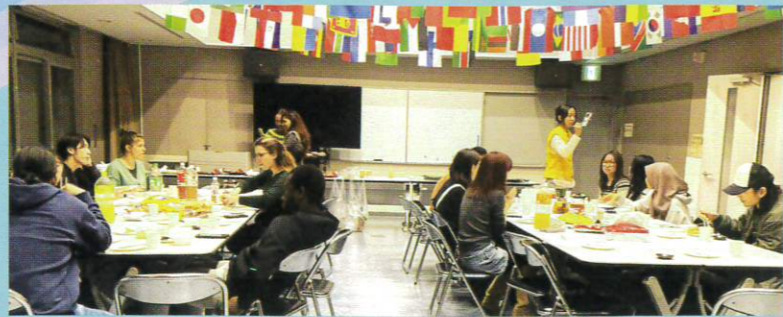
送別会 楽しいことがいっぱいあったね