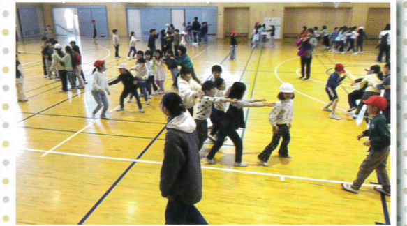
台湾のゲームでみんな大喜び