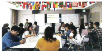
オリエンテーション 今日はちょっとリラックス