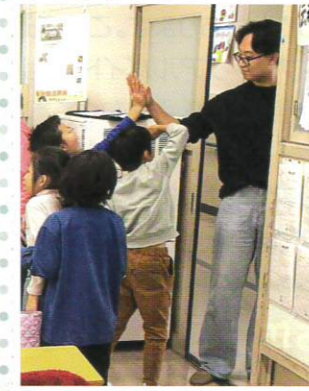
すっかり仲良くなりました