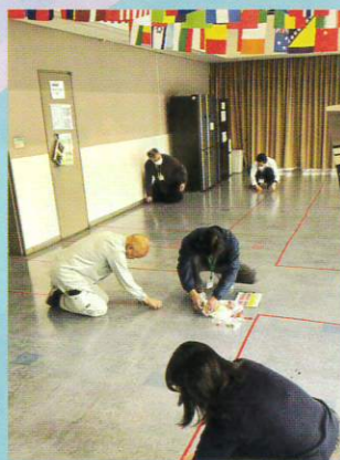
荷物置き場準備中