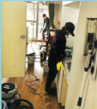
新入館者のために業者さんが大急ぎでお掃除