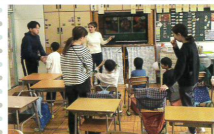
個別指導クラスの子たちもかわいい