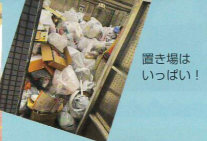
置き場はいっぱい!