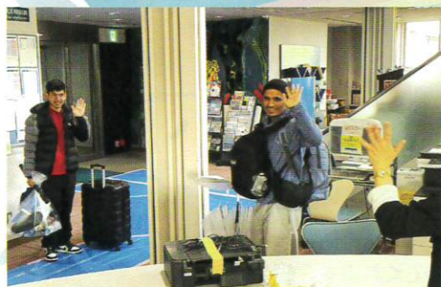
引っ越し荷物が重い