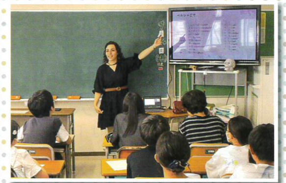
みんな熱心に聞いています