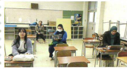
授業開始5分前の控室 ちょっと緊張ぎみ