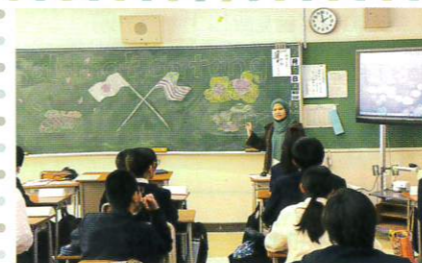
黒板いっぱい歓迎のメッセージ

スクールビジットクラスの申込みは学生会館HP( https://yish-yoke.com/ )からどうぞ