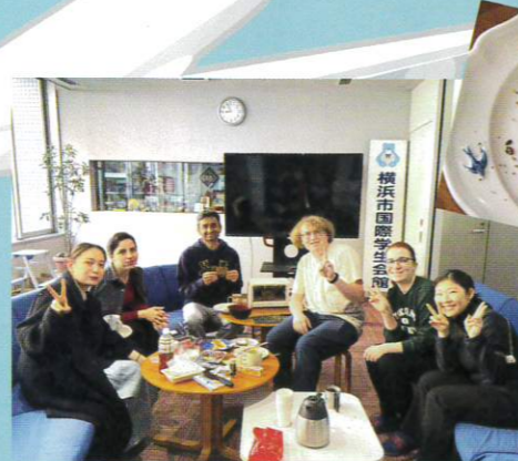
この日はドイツの朝食