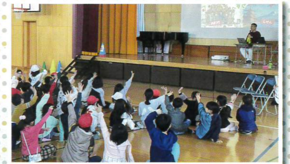
2学年合計8クラスが体育館に集合