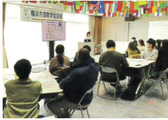
入居契約説明会 みんな神妙