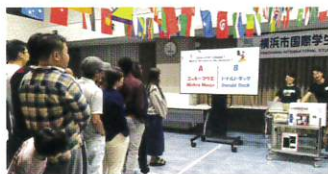
歓迎会 楽しいクイズと おいしいご馳走たっぷり