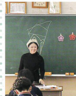
中国伝統の"切り紙"を紹介