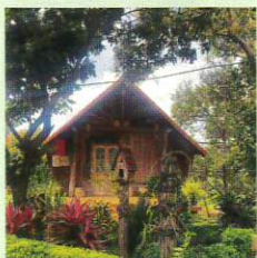
高床式の伝統的な家屋

私の故郷は、ベトナムの中部高原に位置するダクラク省です。この地域は豊かな自然と多様な文化で知られており、ベトナムの中でも特に魅力的な場所の一つです。省都はバンメトート市で、ベトナムのコーヒーの中心地として広く知られています。