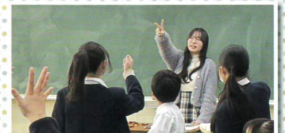
じゃんけんゲームで大盛り上がり