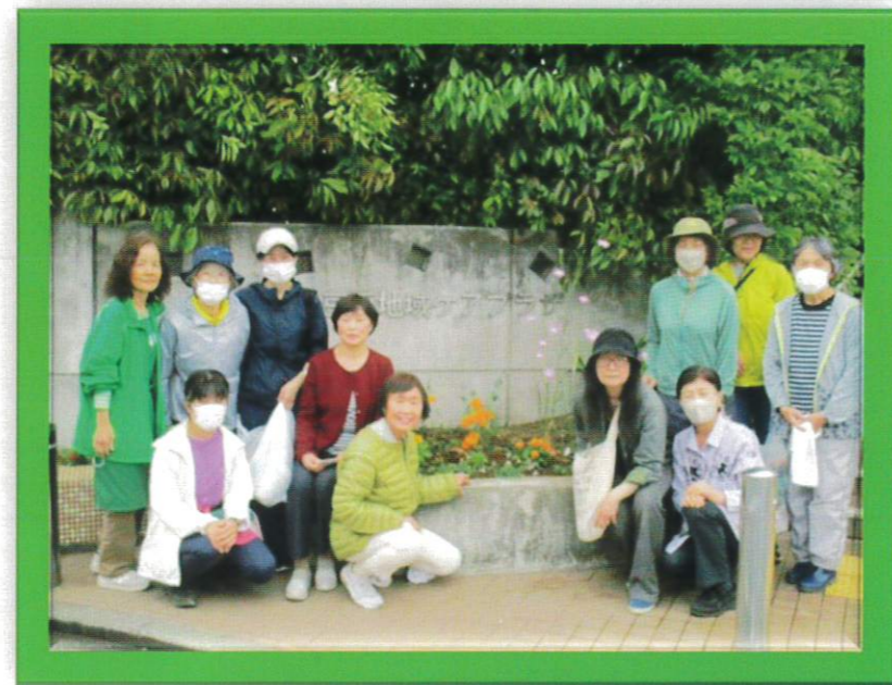
当日、ご参加いただいた皆さんで、お花をバックに記念写真♪