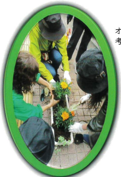
オレンジ・緑・黄色、彩を考えながら植えました。

当日はオレンジ色のマリーゴールドを基調にした寄せ植えに挑戦!! ケアプラザの玄関エントランスに素敵な寄せ植えができました。このオレンジ色に彩られた花々が、ケアプラザにお越しくださる地域の皆さんを、温かく見守っていきます。