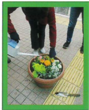
たっぷりとお水をあげます