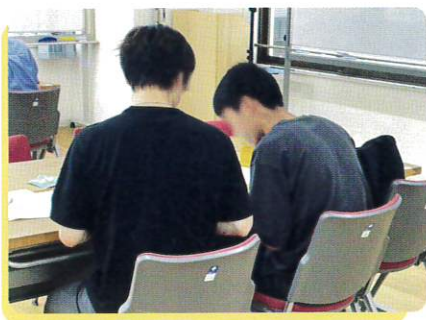
学習支援「まなびれっじ」

私が苦戦しているところを どの問題も 順を追って丁寧に 教えてください 解き方を理解することが できました。