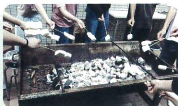
夏のバーベキュー交流会

Aさんの自分のやりたいことを突き詰めていく 姿勢はとても素敵だと思います。 進路だけではなくこれからも 様々な選択肢があって悩むことがあると思いますが Aさんが納得できる進路を選択できることを 応援しています！（学習ボランティアの声）