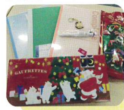
学習用ノートの提供