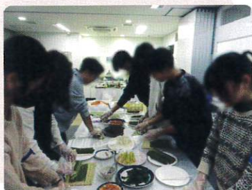
交流会「キンパ作り」