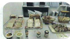
「まなびれっじ」の 昼食支援