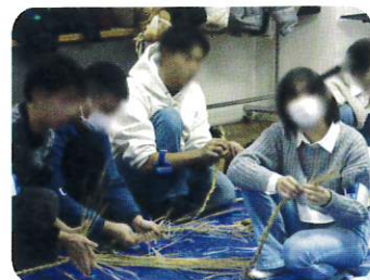
交流会「しめ縄作り」

私が苦戦しているところを どの問題も 順を追って丁寧に 教えてください 解き方を理解することが できました。