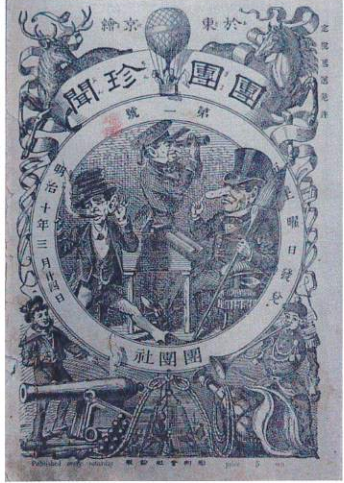
團團珍聞(まるまるちんぶん) 第1号 1877(明治10)年3月24日

オモテ面の画像はいずれも「時事漫画」日曜付録 （左上）1923（大正12）年10月7日 （右上）1929（昭和4）年1月13日 （真ん中）1929（昭和4）年2月24日 （左下）1926（大正15）年11月7日 （右下）1929（昭和4）年5月19日