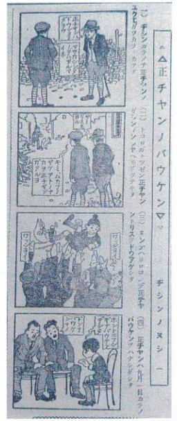
東京朝日新聞 「正チャンノバウケン」 作:織田小星、画:樺島勝一 1923(大正12)年10月20日