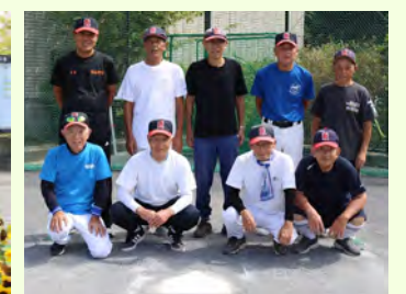
取材日の活動参加は9人。80代が5人で89歳の方も！