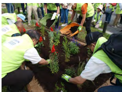
蒔田の森公園（南区）でも同様に講習会を実施し、たくさんの方が参加されました。