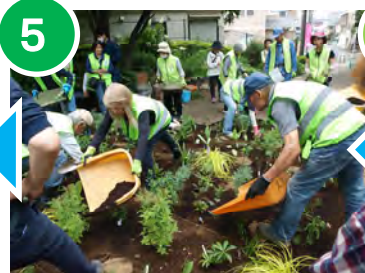
5 はまっ子ユークでマルチングを行いました。