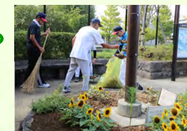
ひまわりを植えた花壇の周りの清掃