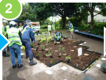
2 計画図に合わせて花壇に花苗を配置しました。