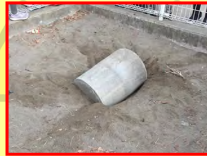
砂場のコネ台の転倒