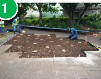
1 花壇に1㎡がわかるように紐で線を引きました。