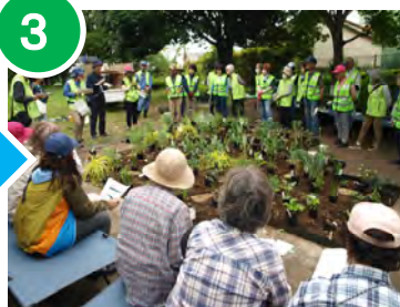
3 各花苗の役割や配置について解説していただきました。