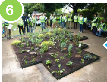
6 水たまりができるまでたっぷり水やりをして完成！