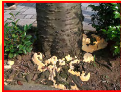
キノコが生えた樹木

不具合等を早く見つけることで、市民の皆様への被害を防ぐことができますので、公園に行った際にお気づきのことがございましたら、該当の公園を管理している各区土木事務所及び公園緑地事務所へご連絡をお願いいたします。