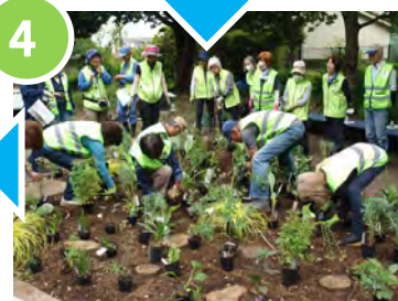
4 配置した場所に植え付けを行いました。