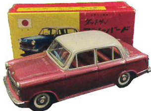
日産自動車のプリキおもちゃ ブルーバード (北原コレクション)