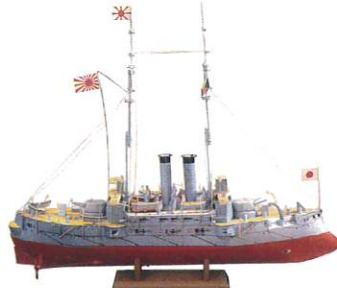
雑誌録録 立体 軍艦三笠 (北原コレクション)

会期内エントランスにて資料写真のトレースを使ってむりえ・作画体験ができます。投稿したむりえはX(旧Twitter)にて不定期発表。 (むりえはお持ち帰りもできます。トレースはwebページにてDLできます)