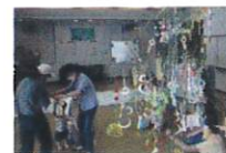
セタイイベントの様子