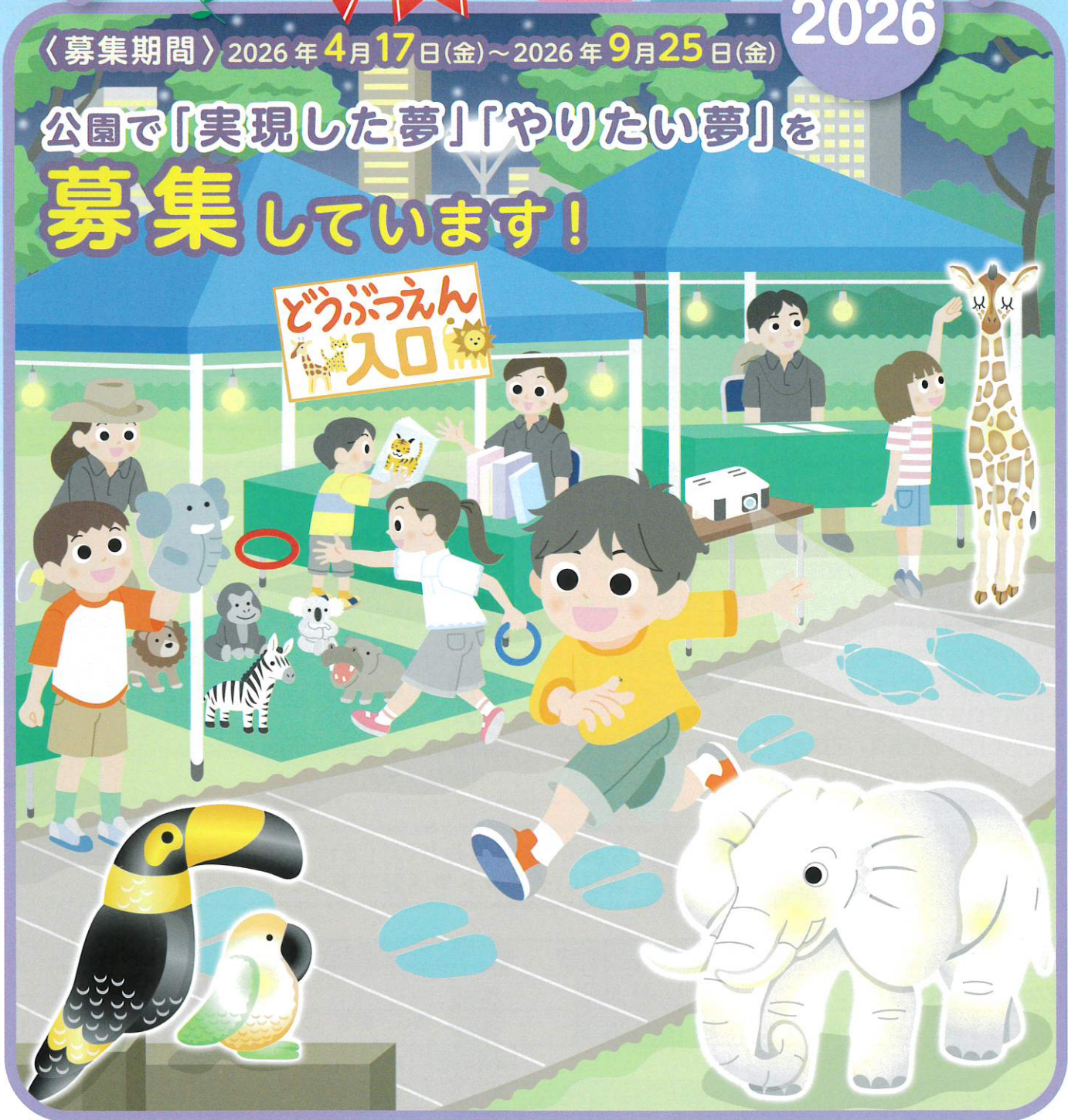
2025年に最優秀賞を受賞した『イマーシブナイトZOO～よるのゆめどうぶつえん～』をイメージした絵です